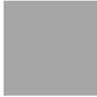
Figura 2: Immagine con quadrato grigio centrale su fondo chiaro. Per l'effetto di contrasto il quadrato appare scuro. Si confronti l'immagine con la figura 1 nella quale il quadrato centrale, pur essendo dello stesso livello di luminanza, appare invece scuro.