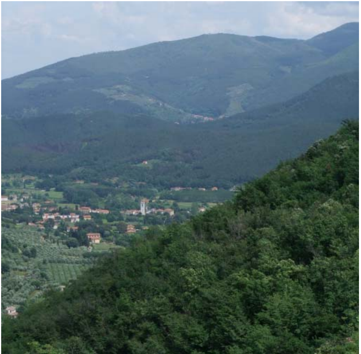
Fig. 5. Le pendici lucchesi del Monte pisano verso San Lorenzo a Vaccoli