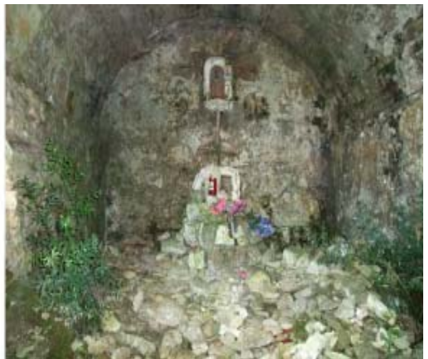
Fig. 6 A sinistra, la grotta principale dell'Eremo di Rupe Cava e, a destra, una delle cappelline situate in prossimità dell'Eremo, lungo la strada che sale da Ripafratta alla Romagna.