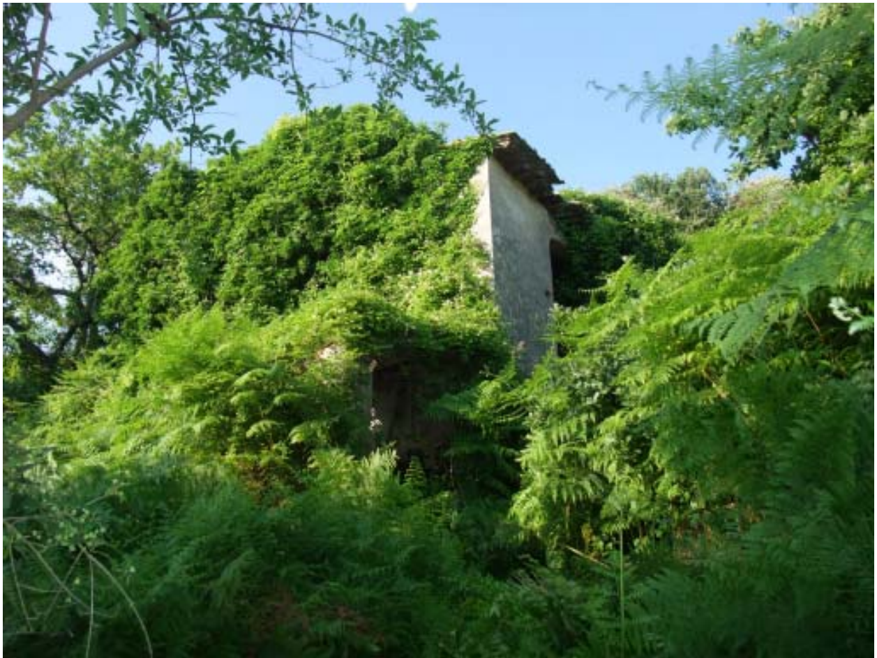
Fig. 7 La natura riprende il sopravvento: la boscaglia ha quasi completamente inglobato una casa diroccata situata sulle pendici del monte, presso la località "La Degna".