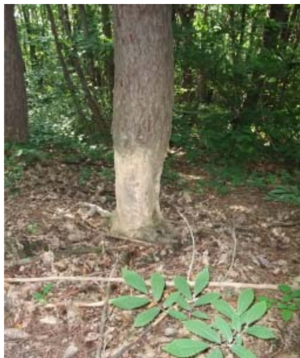
Fig. 2 La pozza dei cinghiali sulle pendici del Monte Penna, con (sopra) il tronco di un castagno assottigliato per l'abitudine di questi animali di sfregarsi nel tentativo di liberarsi dal fango dopo essersi rotolati nelle acque melmose.