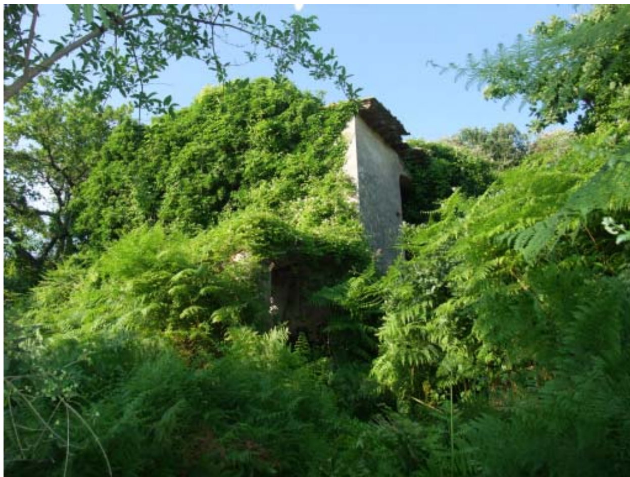
Fig. 7 La natura riprende il sopravvento: la boscaglia ha quasi completamente inglobato una casa diroccata situata sulle pendici del monte, presso la località "La Degna".