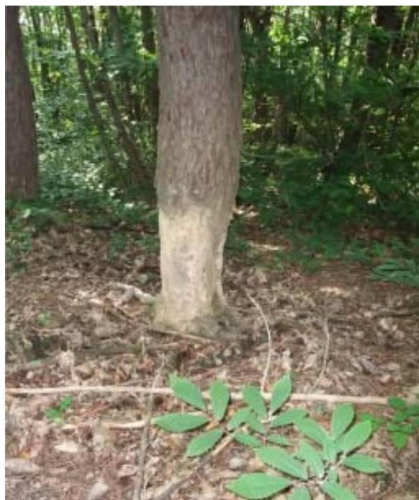
Fig. 2 La pozza dei cinghiali sulle pendici del Monte Penna, con (sopra) il tronco di un castagno assottigliato per l'abitudine di questi animali di sfregarsi nel tentativo di liberarsi dal fango dopo essersi rotolati nelle acque melmose.