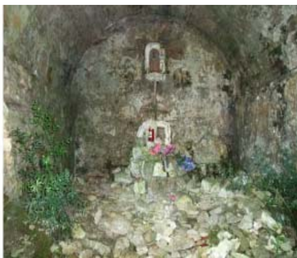
Fig. 6 A sinistra, la grotta principale dell'Eremo di Rupe Cava e, a destra, una delle cappelline situate in prossimità dell'Eremo, lungo la strada che sale da Ripafratta alla Romagna.