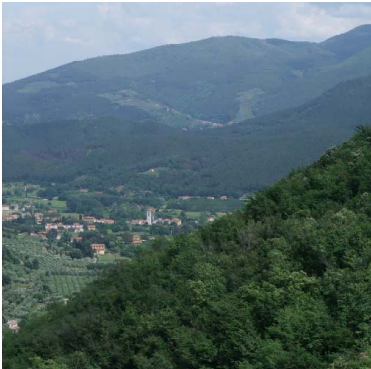
Fig. 5. Le pendici lucchesi del Monte pisano verso San Lorenzo a Vaccoli