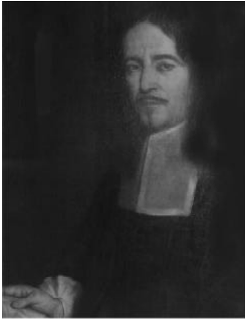
Fig. 1. Marcello Malpighi (Dal ritratto inviato da Malpighi stesso alla Royal Society di Londra). Malpighi (1628-1694), uno dei più importanti scienziati del Seicento, fu tra i primi a concepire il funzionamento degli organismi animali sulla base di una serie di minute “macchine organiche”. Egli iniziò l’anatomia microscopica e diede contributi importanti all’anatomia comparata, alla botanica e alla entomologia. Tra le sue scoperte più importanti è da annoverare la dimostrazione della struttura alveolare del polmone, l’individuazione della struttura secretiva del rene (i “glomeruli” di Malpighi) e, soprattutto, la dimostrazione dell’esistenza dei capillari (che egli intravide per la prima volta nel polmone di rana). La scoperta dei capillari concludeva idealmente la scoperta della circolazione del sangue di Harvey il quale aveva supposto che il sangue portato dalle arterie verso i tessuti tornasse poi attraverso le vene, senza aver però individuato le vie del passaggio artero-venoso.

Galeno. Ma le fondamenta della medicina classica furono scosse in modo importante dalla dimostrazione della circolazione del sangue data da William Harvey nel 1628, una scoperta che metteva in crisi tutto l’impianto della fisiologia di Galeno basata sulla dottrina degli umori e sull’idea che il sangue, prodotto nel fegato a seguito di una trasformazione degli alimenti assorbiti analoga a una lenta cottura (“concozione”) fosse portato dai vasi sanguigni verso i tessuti irrigandoli con un movimento bidirezionale di va e vieni. [vedi Inserto 2 ]